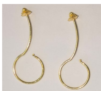
图31 丁香耳勾（已婚佩戴）