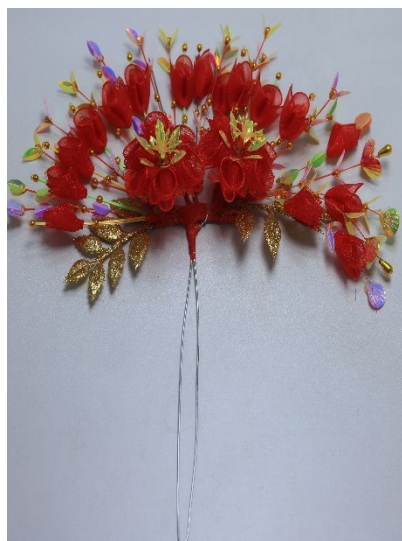
图 20 大边花

6.4.2 熟花边花主体材料一般采用绢布、塑料等，辅助材料常用丝线等，通过巧妙的编织和缝制等使之形态和色彩搭配与真实花朵相似。熟花边花包含大边花、枝仔花（示意图见图 20、图 21、图 22）等。