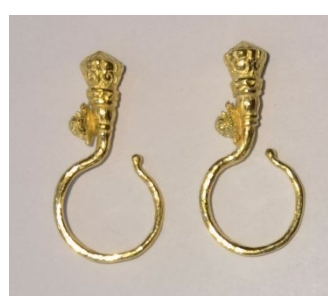
图32 老嬷丁香（祖母辈佩戴）