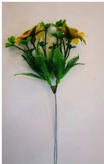
图 21 枝仔花