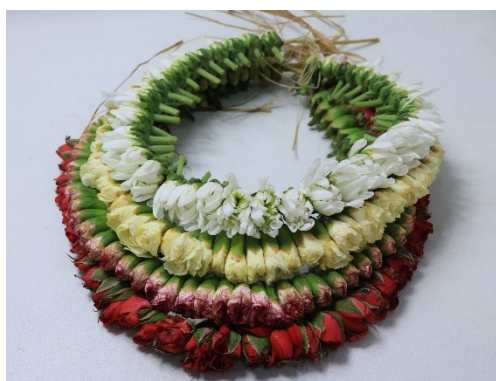
图 18 生花花串

6.3.2 熟花花串（示意图见图 19）采用绢布、塑料等材质以及丝线等辅助材料，通过巧妙的编织、粘制或缝制等工艺，使之呈现与鲜花相似的生命力。