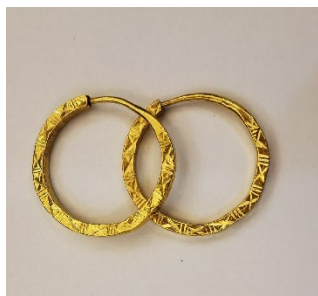
图30 丁香仔（未婚佩戴）

丁香耳环为黄金制品，根据未婚、已婚、祖母辈罍埔女对应佩戴的丁香耳环款式（示意图依次见图30、图31、图32）进行制作。