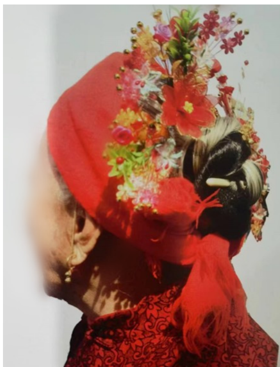
图15 老年蟳埔女簪花围