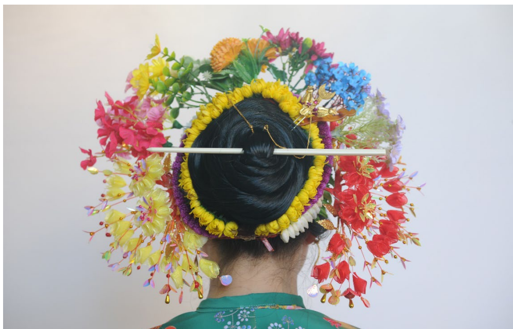
图14 佩戴钗仔针等，完成簪花围

5.2.4.4 老年蟳埔女簪花围一般会适当减少花串和边花数量，并习惯在额头扎戴红色头帕（示意图见图15）。