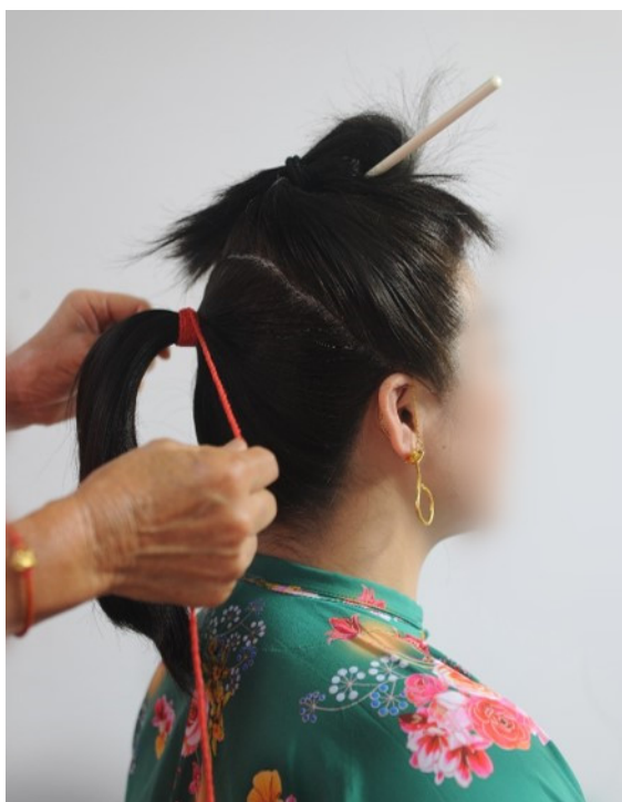
图3 后部分头发扎马尾