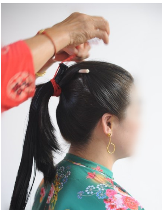
图4 前部分和后部分头发合扎马尾