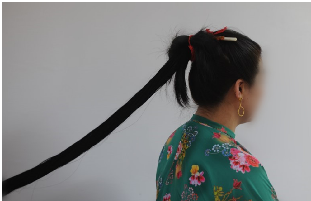
图5 长马尾拧成一股绳状

将长马尾辫拧成一股细长绳状（示意图见图5），再将绳状马尾一圈一圈螺旋式绕到手上，发圈自然由大及小（示意图见图6），接着以马尾根部为中心，将发圈由小及大、由里及外，一圈圈盘按成扁平螺旋状圆形发髻，紧接着抽出骨笄固定圆髻（示意图见图7）。剩余马尾发尾一小截头发，与留存的红绳合拧缠绕、将其固定环绕于马尾根部隐藏。