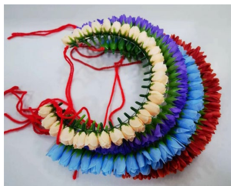
图 19 熟花花串