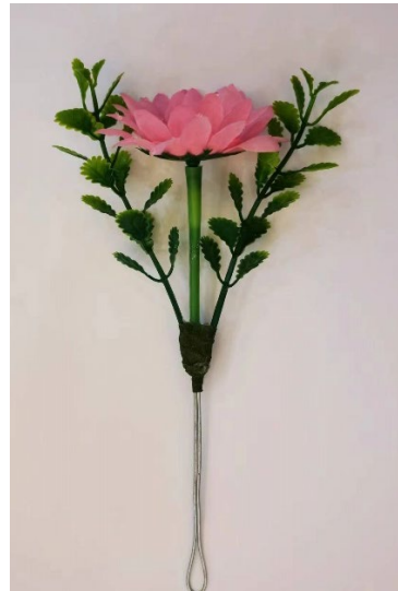
图 22 枝仔花