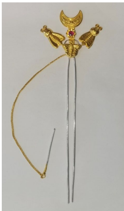
图 25 钗仔针（月牙簪）

型。钗脚由2根银针组成，蝴蝶造型的金饰下方通常连接着一条金链子，链尾连接着一根银针，用于辅助佩戴、防止掉落。