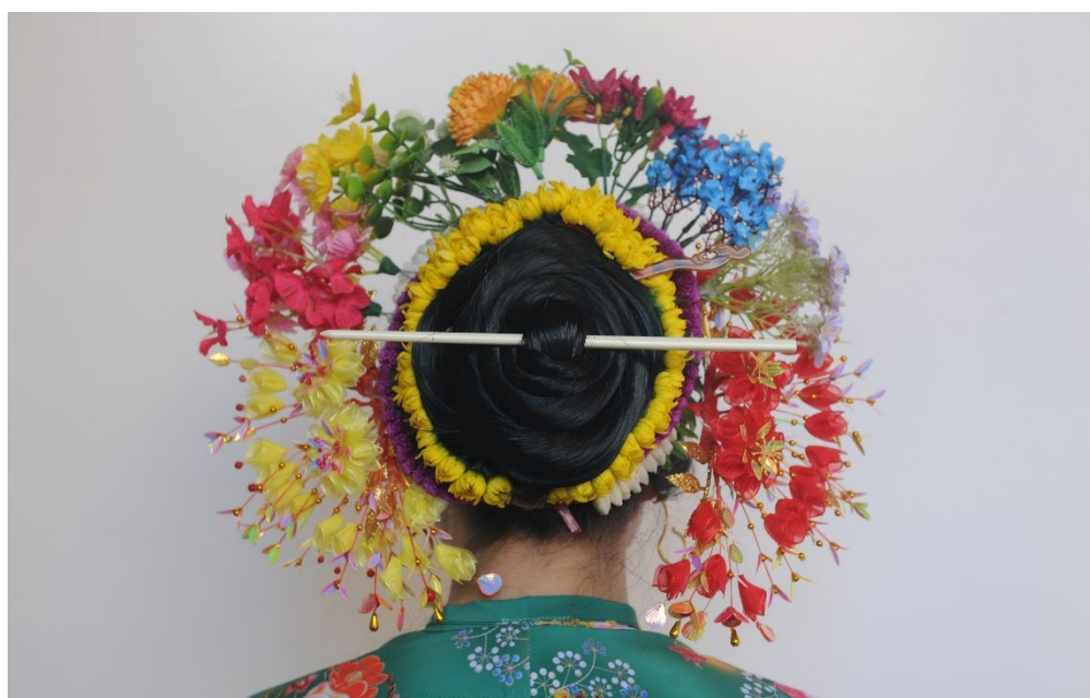
图12 完成花串和边花佩戴