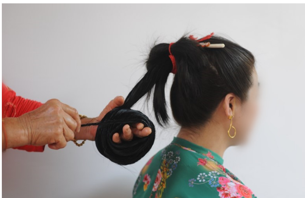
图6 绳状长马尾盘成螺旋状