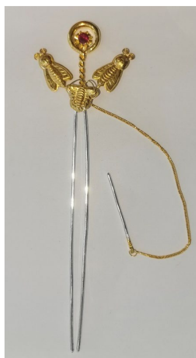
图 26 钗仔针（满月簪）